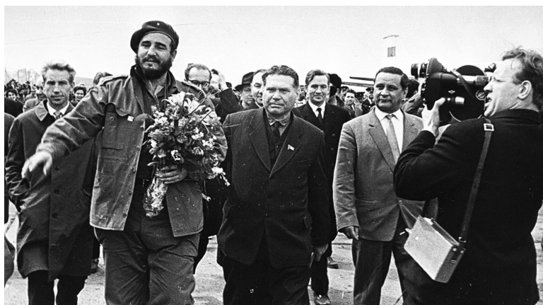
Лето 1961 г. Визит Фиделя Кастро в Красноярск.